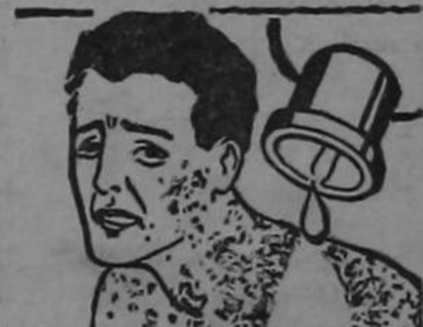
Miles de personas han experimentado alivio casi instantáneo usando LAVOL—el lavado sanitario—aún en los casos sobre agudos de enfermedades cutáneas.