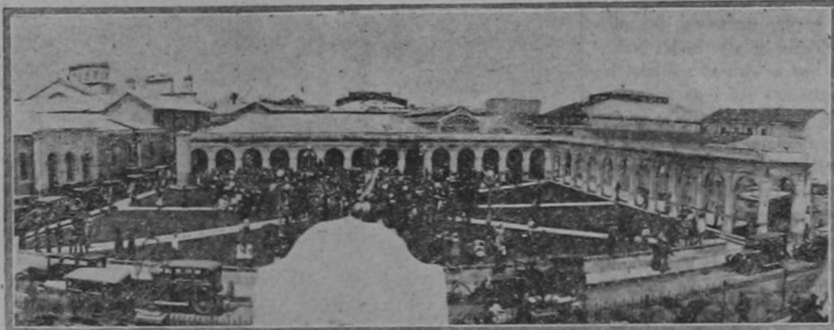
Frente a la estatua de nuestro símbolo, don Juan Mora Fernández, se aglomera la multitud para aplaudir a los cadetes al colocar la placa conmemorativa.

acompañados de casi todos los Representantes diplomáticos acreditados en Costa Rica, que allí habíanse reunido para congratu-