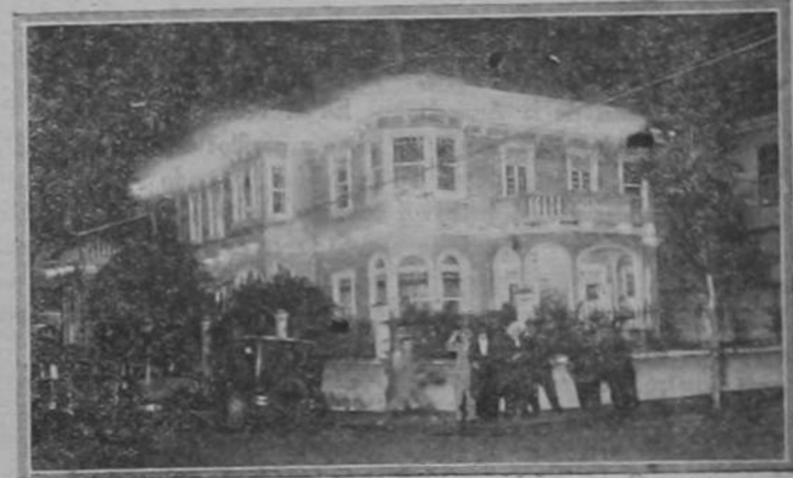
La Legación Argentina ha estado de gala estos días. De la espléndida iluminación da una idea la foto.

La Banda de la Sarmiento ejecutó con verdadera maestría nuestro Himno Nacional y el Argentino a continuación. Menuda pero molesta lluvia precipitó el desfile, regresando los Cadetes, en medio de la muchedumbre que los aplaudía y admiraba y hasta envidiaba, a la estación, donde